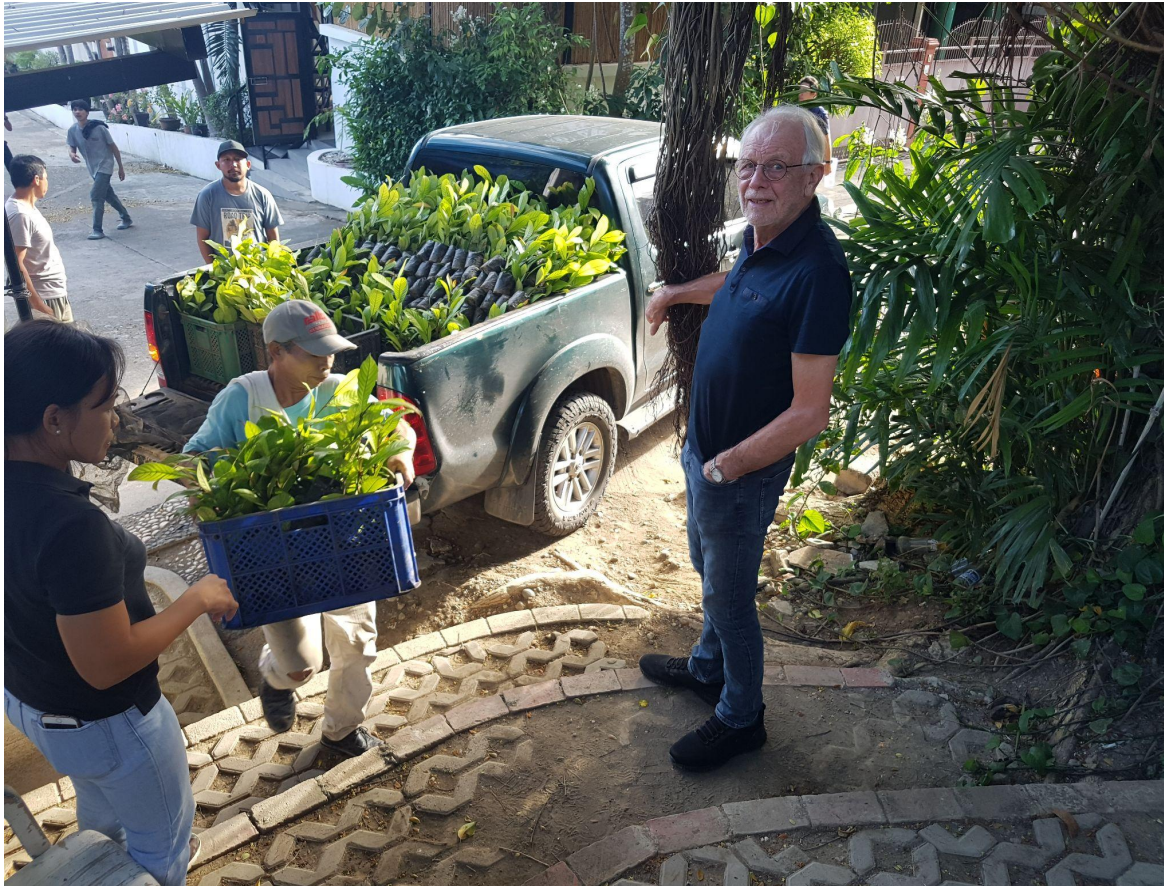
Foto 5: Zaailingen voor nieuwe SPzm aanplant op weg naar de nursery